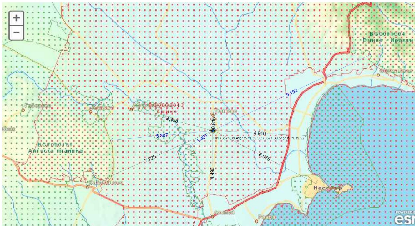
Разстояния от ИП до населени места, защитени зони и защитени територии